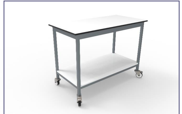
Variante 4 traverses avec option tablette en partie basse