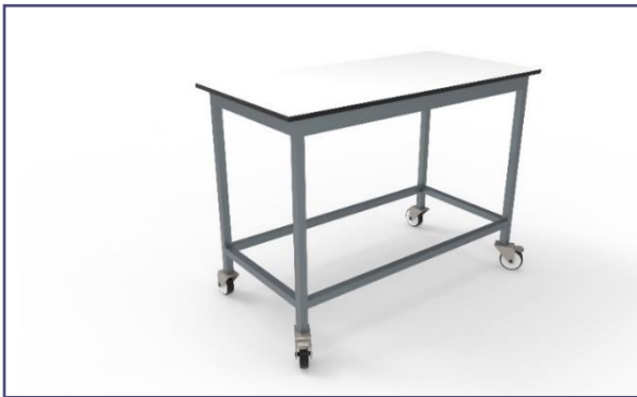
Variante 4 traverses