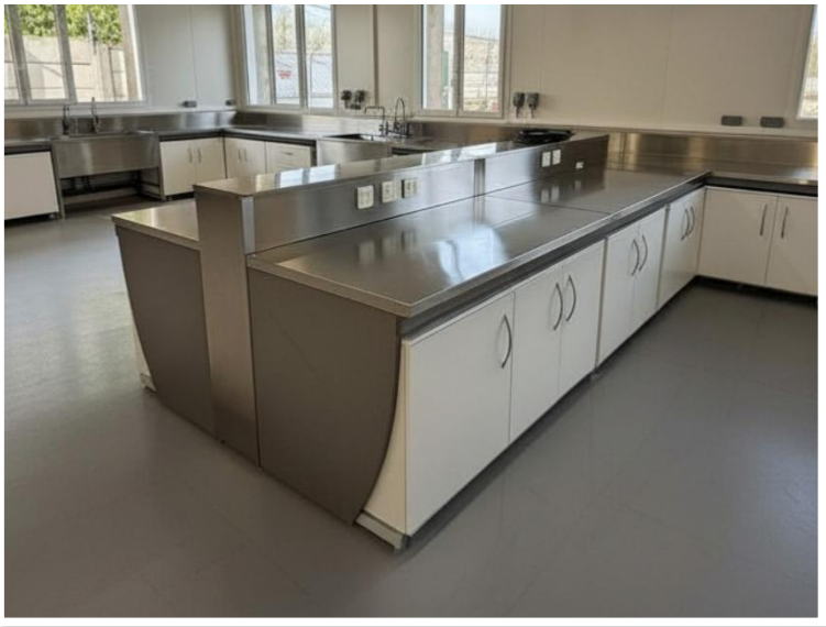
Plan de travail et dossier en inox pour ilot central