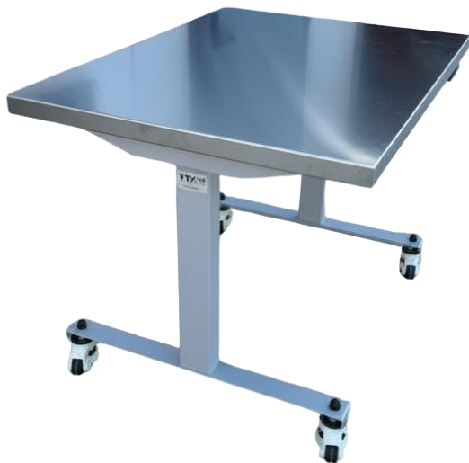
Plan de travail en inox pour paillasse élévatrice électrique