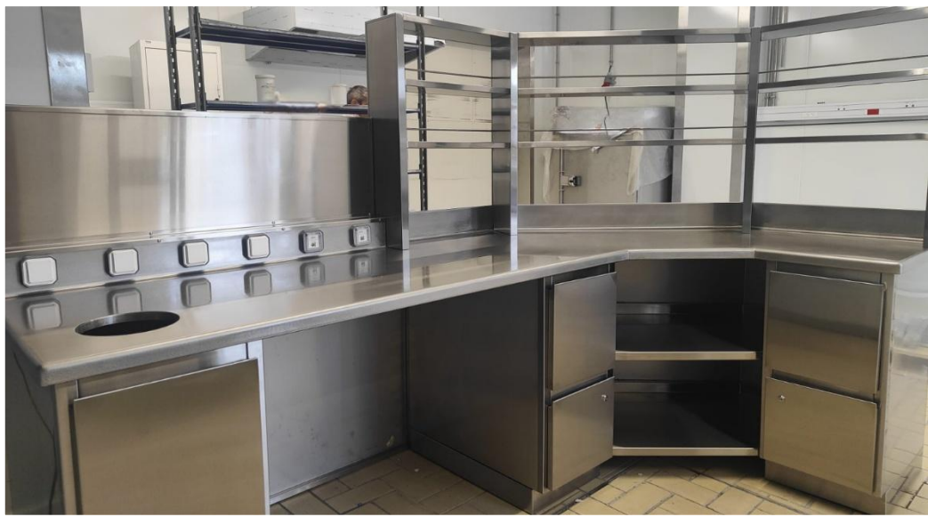
Orgue en angle Secteur arômes