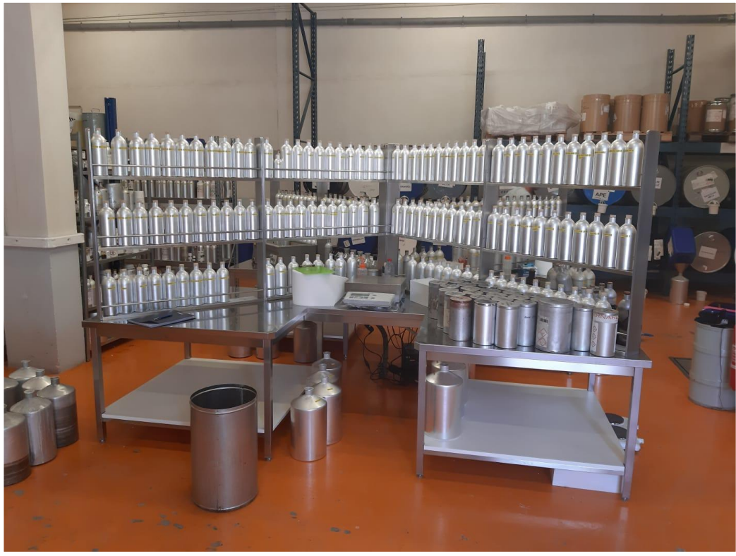
Orgue de pesée pour zone de production en parfumerie