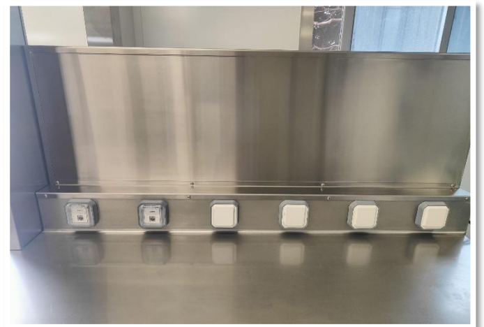
Encastrement de prises dans une réalisation sur mesure