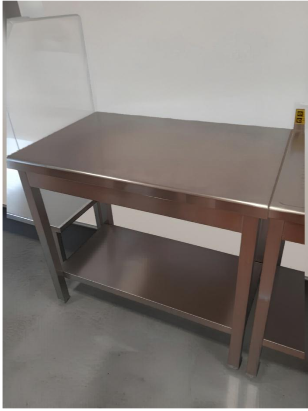
Paillasse fixe avec étagère basse