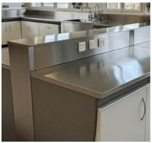
Plan de travail et dossier-tablette en inox