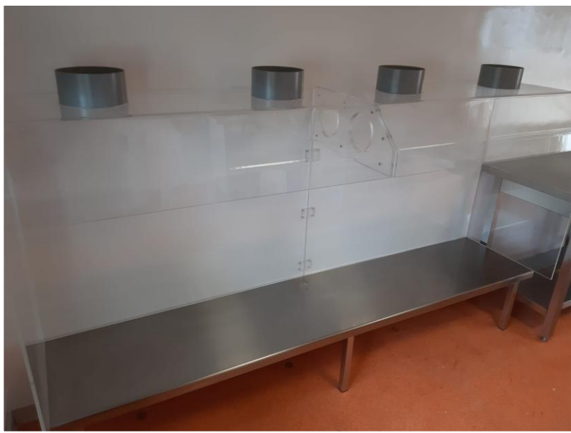
Paillasse basse pour capotage