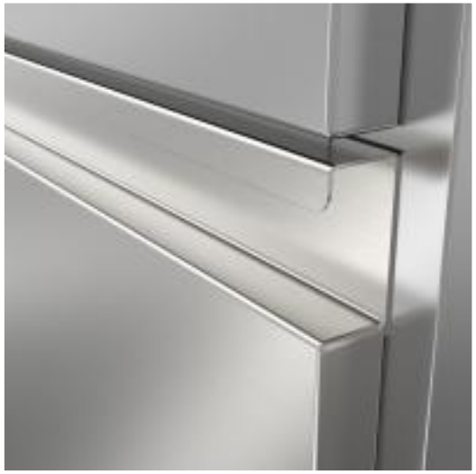
Poignée classique standard pour meubles de rangement, version poignée filante.