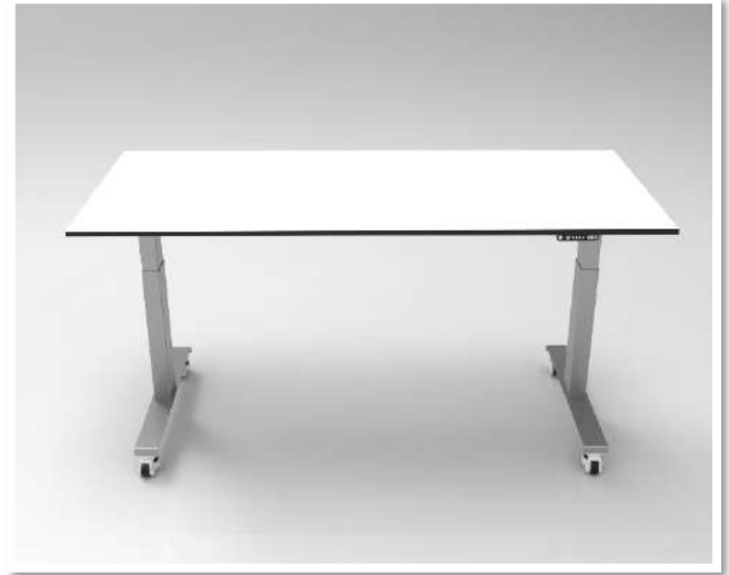
Sans angles arrondis