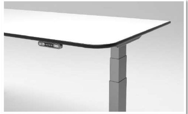
Avec angles arrondis